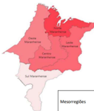
MESORREGIÕES MARANHENSES E PIB PER CAPITA